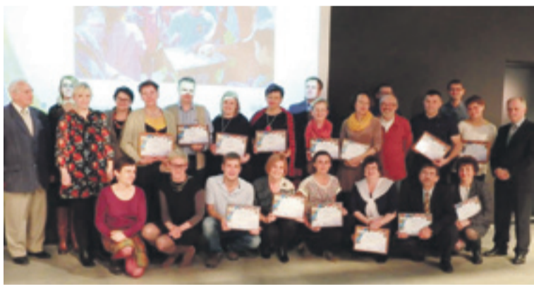
Producenci i usługodawcy wyróżnienie Znakem podczas uroczystości wręczenia certyfikatów.

Kupując produkty i usługi rekomendowane Znakem „Dolina Baryczy POLECA”, wspierasz lokalnych przedsiębiorców oraz przyczyniasz się do zachowania unikatowych walorów przyrodniczych i kulturowych regionu.